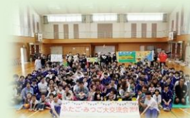
和歌山信愛女子短期大学にて 「ふたご・みつご大交流会」 に参加しました！