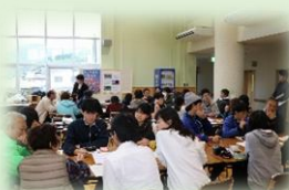
天野地域交流センター 「ゆずり葉」にて 地域の方と共に地域を 考えるFWの実施！

和歌山大学・和歌山県立医科大学・和歌山信愛女子短期大学の学生が社会教育・生涯学習を学ぶことを目指して作ったサークルです。今年度は和歌山県伊都郡かつらぎ町天野地域をフィールドに、地域のために学生の活力をどう生かせるのかを考えながら、活動を行ってきました。また、学生同士が大学間交流を行い、他大学・他学部のことを知り、取り組みに参加する中で、学び合うことも目的のひとつです。