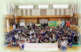
和歌山信愛女子短期大学にて 「ふたご・みつご大交流会」 に参加しました！