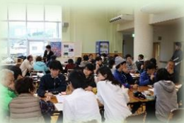
天野地域交流センター「ゆずり葉」にて 地域の方と共に地域を 考えるFWの実施！

和歌山大学・和歌山県立医科大学・和歌山信愛女子短期大学の学生が社会教育・生涯学習を学ぶことを目指して作ったサークルです。今年度は和歌山県伊都郡かつらぎ町天野地域をフィールドに、地域のために学生の活力をどう生かせるのかを考えながら、活動を行ってきました。また、学生同士が大学間交流を行い、他大学・他学部のことを知り、取り組みに参加する中で、学び合うことも目的のひとつです。